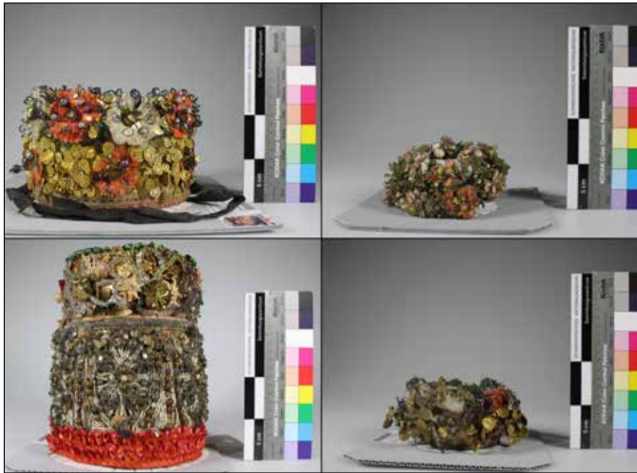
Fig. 1 : Les 4 Schappel sélectionnés en tant que représentants de la collection du MNS. Dans le sens de lecture : LM-4869, LM-13833, LM-91720, LM-3249-10.

Protocole de restauration applicable à la collection de Schappel présente au centre des collections du MNS (études, analyses et interventions réalisées sur 4 Schappel)