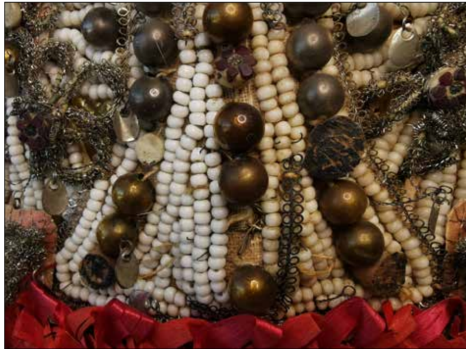
Fig. 2 : Nettoyage des perles de rocailles du Schappel LM-91720. À droite = avant traitement, à gauche = après traitement.