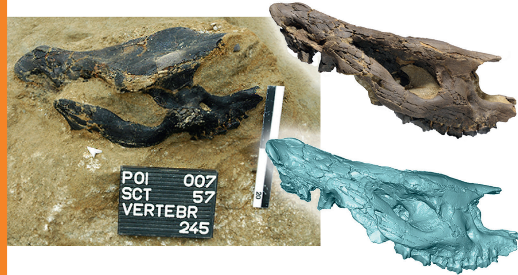
Préparation, restauration et étude d' Epiacatherium delemontense , illustration ©Olivier Maridet

Haute Ecole Arc Conservation-restauration +41 32 930 19 19 conservation-restauration@he-arc.ch www.he-arc.ch/cr