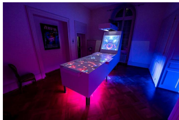
Fig. 2 : Installation du Flipp3r lors du NIFFF