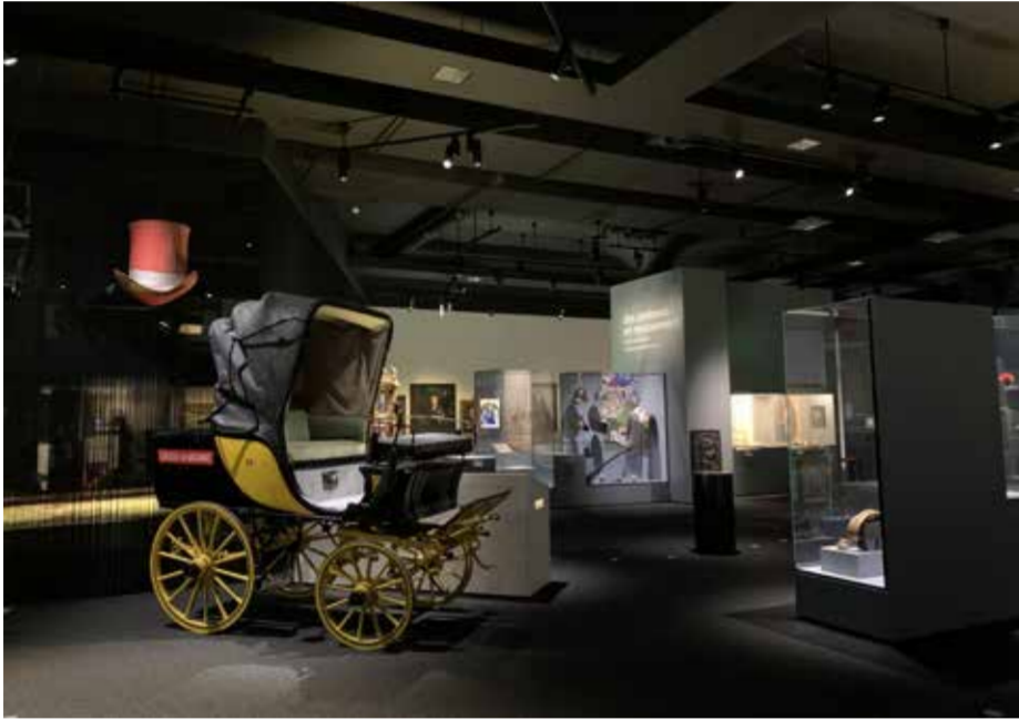
Fig. 1 : Vue de l'exposition permanente du Musée gruérien ©He-Arc, Jasmine Praz, 2024.