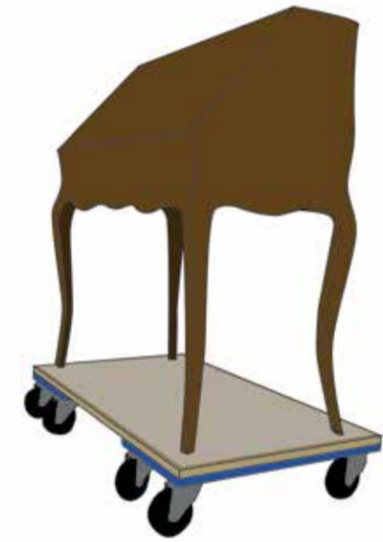
Fig. 3 : Support à roulettes pour stocker le mobilier ©He-Arc, Jasmine Praz, 2024.