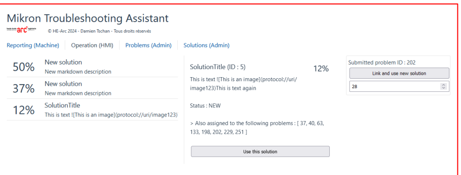
Interface d'exemple – Solutions d'un problème

L'interface d'exemple permet de présenter les fonctionnalités de base et offre une vue d'ensembles des possibilités.