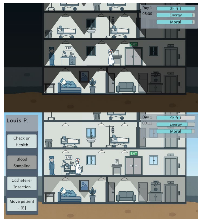
Captures d'écran des niveaux