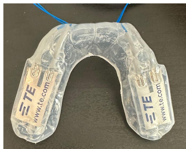
Gouttière expérimentale avec films piézoélectriques intégrés