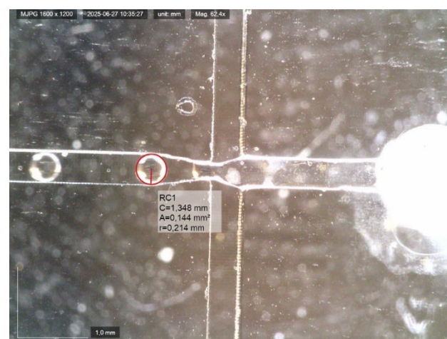
Figure 1 : visualisation de la formation d'une goutte à la jonction « flow-focusing » de la puce microfluidique, cœur du procédé de production

Le procédé développé est une réussite et surpasse les objectifs du cahier des charges. Le débit de production est multiplié par sept, atteignant 4414 capsules/minute (cible > 660 ). Les hydrogels produits respectent les spécifications avec un diamètre moyen de 480 \mu\text{m} (cible \leq 500\ \mu\text{m} ) et une monodispersité exceptionnelle ( \text{CV} de 2.8 %, cible < 10\% ). Une forte corrélation linéaire ( R^2 = 0.83 ) est établie entre le ratio des pressions et la taille finale des capsules, ce qui assure un procédé prédictif, robuste et contrôlable.