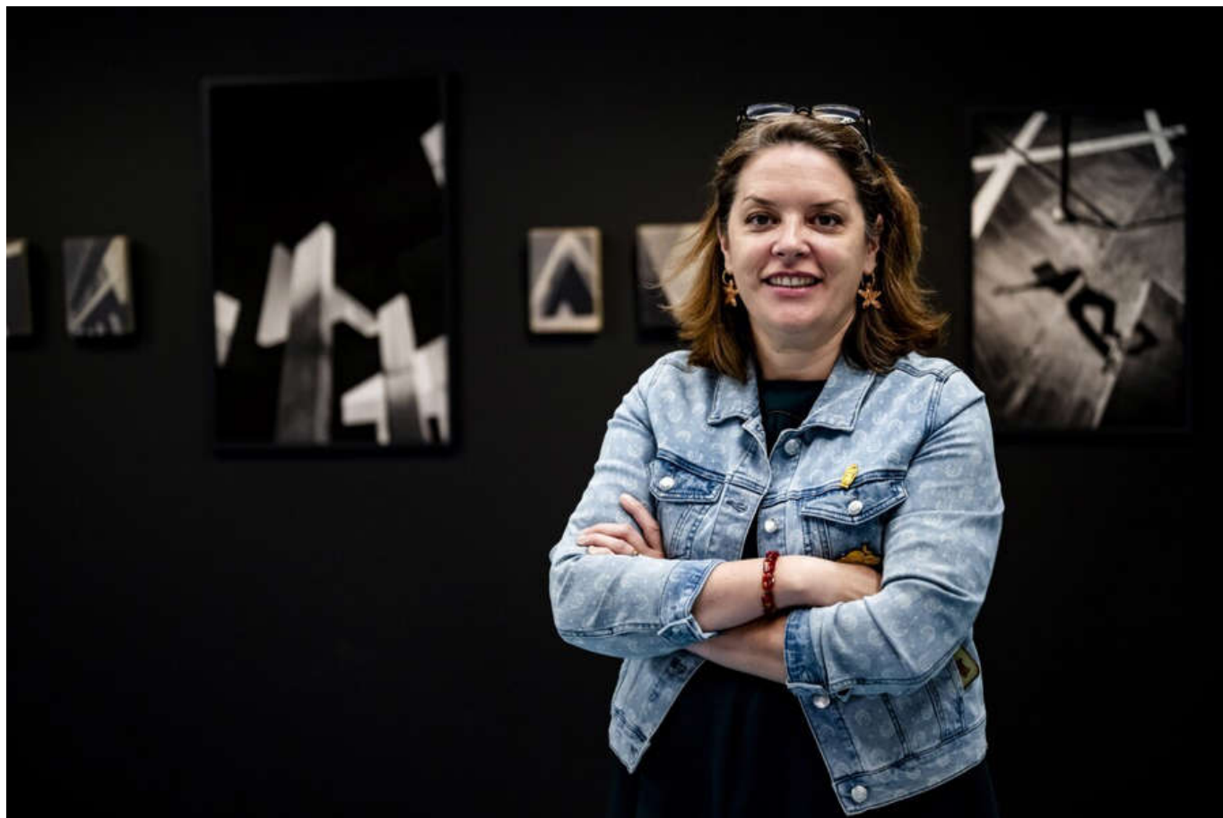
La directrice du MEN, Aurélie Carré, inaugure sa première grande exposition.