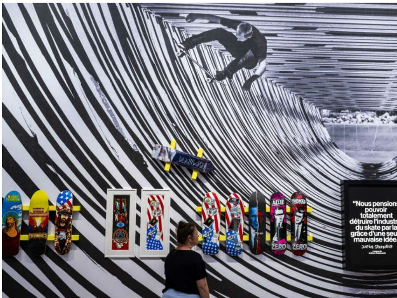
L'exposition «Skate of Mind» montre les graphismes de planches de skateurs qui n'hésitent pas à bousculer les convenances jusqu'à l'extrême.