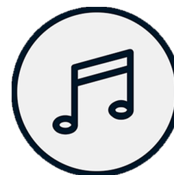
Logo de l'application